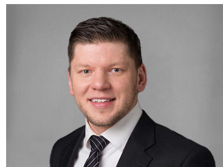
Sebastian Skipper Catering & Partyservice

Tel. 044 492 16 56 Fax. 044 492 16 61 info@metzgereikuenzli.ch www.metzgereikuenzli.ch